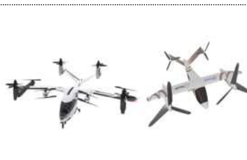
< 도심항공교통(UAM) >