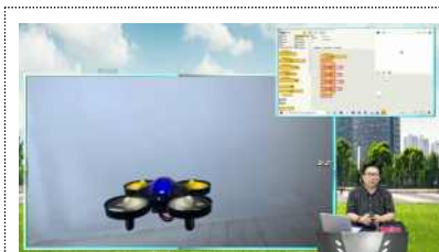
< 코딩드론 수업 >