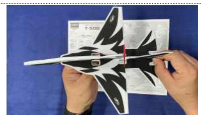
< 전동비행기 제작 >