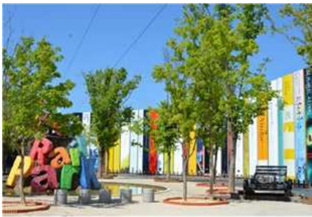
경춘선 김유정역 문학공원