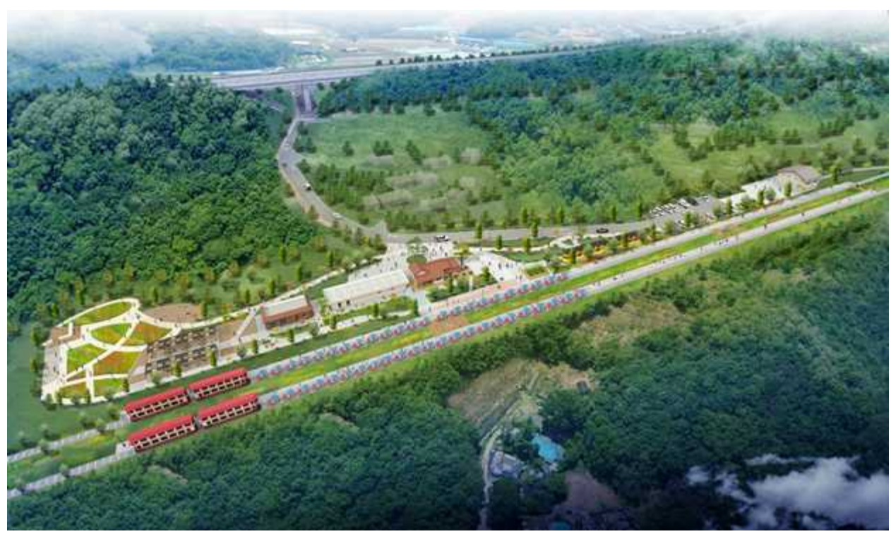
舊단성 ~ 죽령역 개발사업