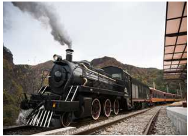
영동선 스위치백 트레인