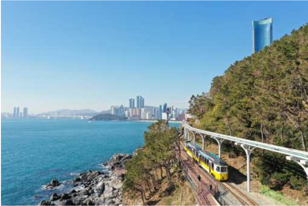
해운대 해변열차, 스카이캡슐 및 산책로