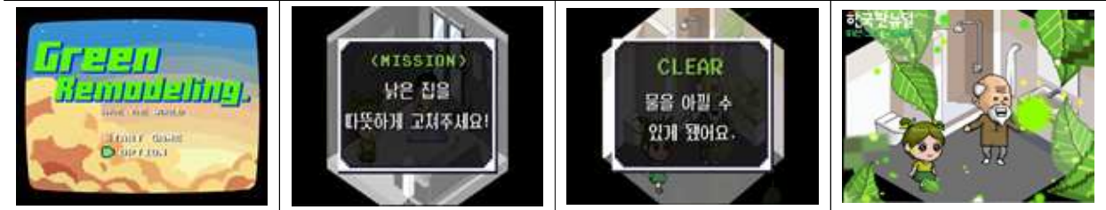
< 게임영상 스틸컷 >