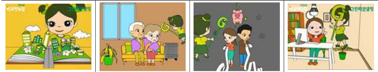
< 동화영상 스틸컷 >